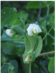
7 Stevns høje ært