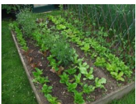
7 Stevns høje ært