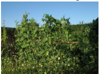
7 Stevns høje ært