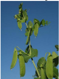
7 Stevns høje ært