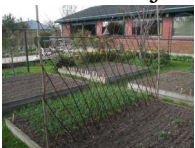
7 Stevns høje ært