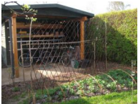
7 Stevns høje ært