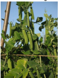
7 Stevns høje ært